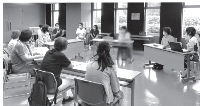
実際の「ひまわり」の様子