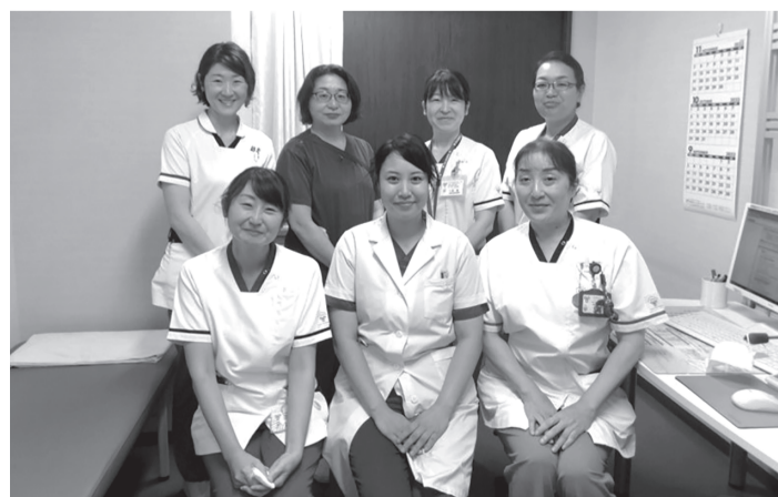
「ひまわり」を運営している医療スタッフ